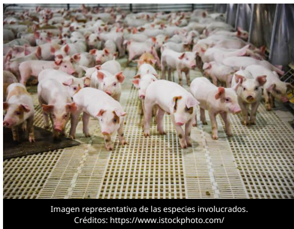
Imagen representativa de las especies involucrados.

El 19 de mayo de 2026, la Oficina del Jefe de Inspección Veterinaria de Polonia confirmó el primer brote de Peste Porcina Africana (PPA) en cerdos domésticos registrado en el país durante 2026.