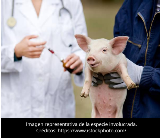
Imagen representativa de la especie involucrada.

El 15 de mayo de 2026, la Organización Mundial de Sanidad Animal (OMSA) publicó nuevas directrices para la evaluación en campo y el monitoreo posterior a la vacunación contra la Peste Porcina Africana (PPA), con el objetivo de establecer criterios internacionales para medir la eficacia, seguridad y desempeño de las vacunas en condiciones reales de producción porcina.