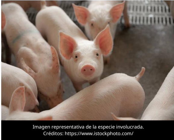
Imagen representativa de la especie involucrada.

El 19 de mayo de 2026, el Ministerio de Agricultura, Alimentación y Asuntos Rurales (MAFRA) informó que, entre enero y marzo, Corea del Sur registró 24 brotes de Peste Porcina Africana (PPA) en siete provincias, la cifra anual más alta desde 2019, lo que llevó al gobierno a reforzar las medidas de control y mantener el nivel de alerta máxima en 32 municipios de alto riesgo.