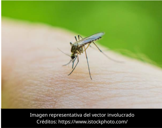
Imagen representativa del vector involucrado

El 19 de mayo de 2026, el Departamento Estatal de Servicios de Salud de Texas confirmó el primer caso de enfermedad neuroinvasiva por Virus del Oeste del Nilo (VON) en 2026, detectado en un residente del condado de Harris, e instó a la población a reforzar las medidas de prevención contra mosquitos ante el riesgo de enfermedades como Dengue, Chikungunya y Zika.