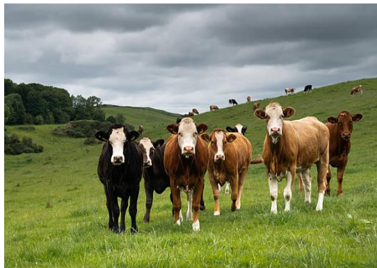
Imagen representativa de las especies involucradas

El 15 de mayo de 2026, el Ministerio de Desarrollo Rural y Alimentación de Grecia informó que intensificaron las acciones de control y bioseguridad frente a la Fiebre Aftosa (FA) en la isla de Lesbos, mediante una operación coordinada en coordinación con ELGO-DIMITRA, con el objetivo de contener la epizootia y proteger la producción ganadera local.