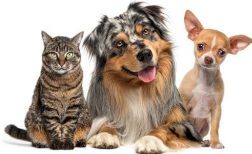
Imagen representativa de las especies involucradas.

El 18 de mayo de 2026, el Ministerio de Agricultura, Alimentación y Asuntos Rurales (MAFRA) informó que la Agencia de Cuarentena Animal y Vegetal de Corea del Sur no detectó casos de Influenza Aviar de Alta Patogenicidad (IAAP) en animales de compañía ni en ganado mamífero durante 2025, tras realizar pruebas de vigilancia sanitaria en perros, gatos, vacas, cerdos y cabras.