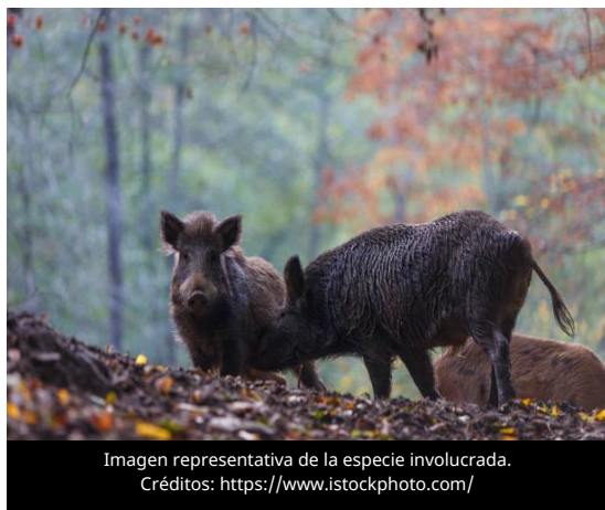
Imagen representativa de la especie involucrada.

El 20 de marzo de 2026, la Organización Mundial de Sanidad Animal (OMSA) publicó el Reporte N° 74 sobre la situación mundial de la Peste Porcina Africana (PPA), correspondiente a febrero de 2026.