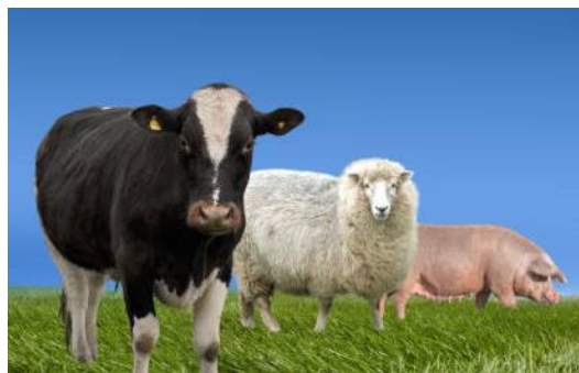
Imagen representativa de la especie involucrada.

El 20 de marzo de 2026, el Instituto Colombiano Agropecuario (ICA), informó que se llevó a cabo en Bogotá un simulacro subregional para el diagnóstico de Fiebre Aftosa (FA), con la participación de expertos de Colombia, Ecuador, Perú y Bolivia, con el objetivo de fortalecer la capacidad de respuesta ante emergencias sanitarias en la Región Andina.