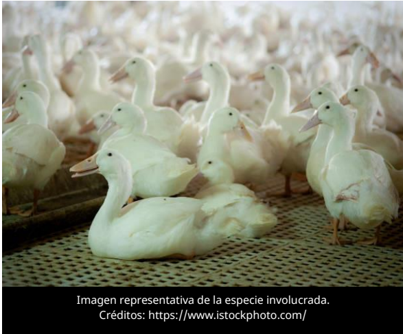
Imagen representativa de la especie involucrada.

El 22 de marzo de 2026, la Junta Estatal de Salud Animal de Indiana (BOAH) confirmó dos nuevos brotes de Influenza Aviar de Alta Patogenicidad (IAAP) en explotaciones comerciales de patos para carne en los condados de LaGrange y Elkhart, ambas en cuarentena y con áreas de control de 10 km y de vigilancia de 20 km activas para contener la propagación del virus.