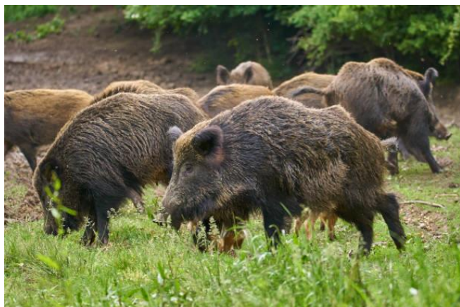
Imagen representativa de la especie involucrada.

El 23 de marzo de 2026, el Servicio Alimentario y Veterinario (PVD) de Letonia publicó la actualización del reporte de casos de Peste Porcina Africana (PPA) en jabalís.