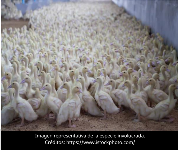
Imagen representativa de la especie involucrada.

El 21 de marzo de 2026, el Ministerio de Agricultura, Alimentación y Asuntos Rurales (MAFRA) informó que el Cuartel General Central de Gestión de Desastres de Corea del Sur confirmó un nuevo brote de Influenza Aviar de Alta Patogenicidad (IAAP) subtipo H5N1 en una explotación de patos de engorde con aproximadamente 12,500 aves en el condado de Jangsu, provincia de Jeonbuk, elevando a 60 los casos registrados en granjas avícolas durante la temporada invernal 2025/2026.