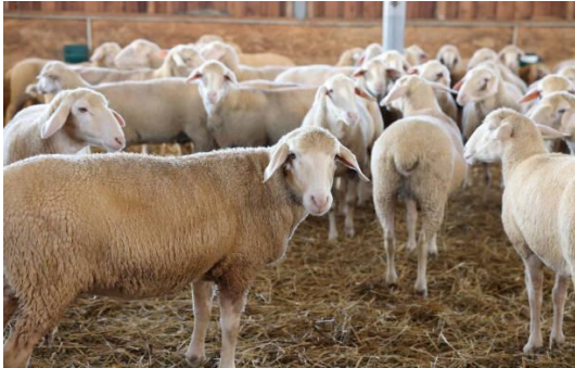
Imagen representativa de la especie afectada

El 8 de junio de 2026, la Autoridad Nacional Sanitaria Veterinaria y de Seguridad Alimentaria de Rumania realizó una notificación inmediata ante la Organización Mundial de Sanidad Animal (OMSA), por el motivo de "Primera aparición en una zona o un compartimento", debido a la detección de nuevos casos de Peste de los Pequeños Rumiantes, en ovinos ubicados en la localidad de Viisoara, condado de Mureş.