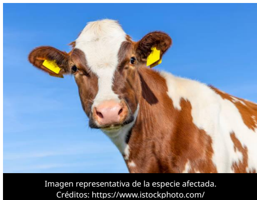
Imagen representativa de la especie afectada.

El 5 de junio de 2026, el Ministerio de Ganadería, Agricultura y Pesca (MGAP) de Uruguay informó que, durante las 53ª Jornadas Uruguayas de Buiatría, la Dirección General de Servicios Ganaderos (DGSG) analizó el panorama mundial de la Fiebre Aftosa (FA), destacando la expansión de serotipos virales hacia regiones donde históricamente no se encontraban presentes. Esta situación subraya la importancia de fortalecer la vigilancia epidemiológica y la preparación sanitaria para reducir el riesgo de introducción de la enfermedad.