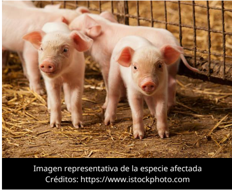
Imagen representativa de la especie afectada

El 8 de junio de 2026, la Autoridad Nacional Sanitaria Veterinaria y de Seguridad Alimentaria (ANSVSA) de Rumania activó de manera inmediata un conjunto de medidas de bioseguridad en el condado de Satu Mare, tras la confirmación de un brote de Peste Porcina Africana (PPA) en una explotación porcina de Hungría localizada en las proximidades de la frontera rumana.