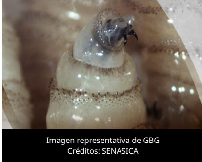
Imagen representativa de GBG

El 8 de junio de 2026, el Servicio de Inspección de Sanidad Animal y Vegetal (APHIS) del Departamento de Agricultura de los Estados Unidos (USDA) confirmó el primer caso de Gusano Barrenador del Ganado (GBG) en el estado de Nuevo México, identificado en un perro del condado de Lea.