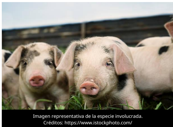
Imagen representativa de la especie involucrada.

El 8 de junio de 2026, la Agencia de Noticias de Filipinas (PNA) informó que la provincia de Abra mantiene como objetivo alcanzar el estatus libre de Peste Porcina Africana (PPA) para finales de 2026, tras no registrar casos de la enfermedad desde enero de este año y permanecer sin reportes durante el segundo semestre de 2025.