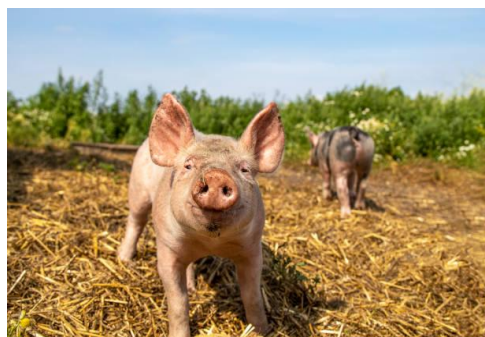
Imagen representativa de la especie involucrada.

El 8 de junio de 2026, el Departamento de Información y Relaciones Públicas del Gobierno de Nagaland confirmó un brote de Peste Porcina Africana (PPA) en la aldea de Thizama, tras recibir un resultado positivo de laboratorio emitido por el Departamento de Ganadería y Servicios Veterinarios.