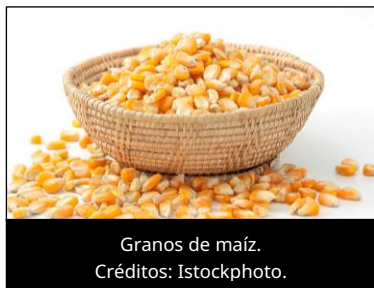
Granos de maíz.

El 26 de junio de 2026, a través del Sistema de Alerta Rápida para Alimentos y Piensos (RASFF) de la Unión Europea, se notificó que, como resultado de una inspección de control en la frontera de Croacia , se detectó la presencia del insecticida pirimifos-metilo en maíz palomero procedente de Estados Unidos.