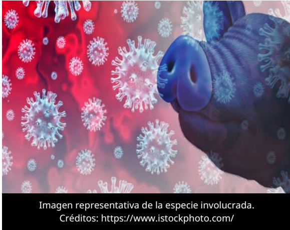
Imagen representativa de la especie involucrada.

El 8 de julio de 2026, la revista científica Frontiers in Veterinary Science publicó un estudio que comparó la transmisión oral del virus de la Peste Porcina Africana (PPA) mediante alimento comercial contaminado y homogeneizado de órganos de cerdos infectados, con el objetivo de evaluar el riesgo de ambas vías de exposición.