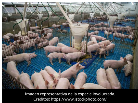
Imagen representativa de la especie involucrada.

El 8 de julio de 2026, el Ministerio de Agricultura y Desarrollo Rural, a través de su Departamento de Inspectoría Veterinaria General, realizó una notificación inmediata ante la Organización Mundial de Sanidad Animal (OMSA), por el motivo de "Recurrencia de una enfermedad erradicada", debido a nuevos casos de Peste Porcina Africana (PPA), en una explotación de cerdos ubicada en la provincia de Kujawsko-Pomorskie.