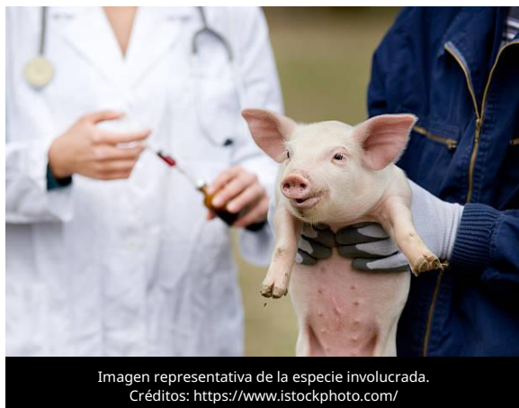
Imagen representativa de la especie involucrada.

El 8 de julio de 2026, la Agencia de Noticias de Filipinas (PNA) informó que el Departamento de Agricultura (DA) de Filipinas informó que la aprobación de vacunas para uso animal será agilizada bajo la supervisión de la Oficina de Industria Animal (BAI), tras la emisión de la Circular Departamental No. 33, que transfiere a este organismo las funciones regulatorias relacionadas con el registro y autorización de productos veterinarios.