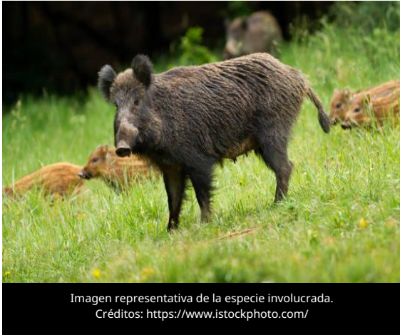
Imagen representativa de la especie involucrada.

El 8 de julio de 2026, la Asociación de Criadores de Cerdos de Alemania (ISN) informó que el Ministerio de Agricultura, Medio Ambiente y Protección del Clima de Brandeburgo confirmó la detección de dos nuevos casos de Peste Porcina Africana (PPA) en jabalís del distrito de Uckermark, tras más de un año sin registros de la enfermedad en la región.