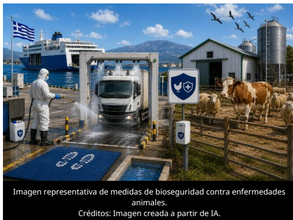
Imagen representativa de medidas de bioseguridad contra enfermedades animales.