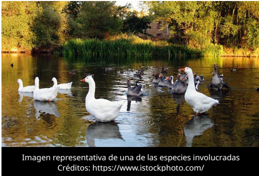
Imagen representativa de una de las especies involucradas

El 8 de julio de 2026, la Autoridad Europea de Seguridad Alimentaria (EFSA) publicó un informe sobre la situación epidemiológica de la Influenza Aviar de Alta Patogenicidad (IAAP) correspondiente al periodo de marzo a mayo de 2026.