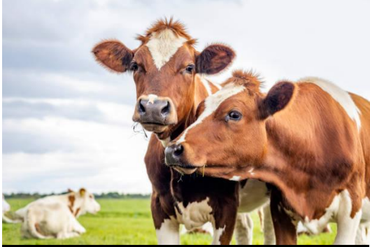
Imagen representativa de la especie involucrada.

El 8 de julio de 2026, la Delegada de Nueva Zelanda ante la Organización Mundial de Sanidad Animal (OMSA) y Jefa de los Servicios Veterinarios informó que se llevará a cabo en Wellington, los días 16, 23 y 30 de julio de 2026, el ejercicio de simulacro de Fiebre Aftosa (FA) denominado «Exercise Cloven Shield», con el objetivo de fortalecer la preparación nacional y la coordinación interinstitucional ante una eventual emergencia zoonosaria.