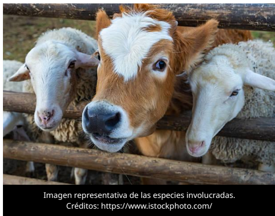
Imagen representativa de las especies involucradas.

El 7 de julio de 2026, el Ministerio de Agricultura, Alimentación y Asuntos Rurales (MAFRA) de Corea del Sur informó la conclusión de la campaña de vacunación preventiva contra el serotipo SAT1 de la Fiebre Aftosa (FA) en 170 mil bovinos, caprinos y otros rumiantes ubicados en 11 ciudades y condados de alto riesgo en la zona fronteriza, como parte de las acciones para prevenir la introducción del virus al país.