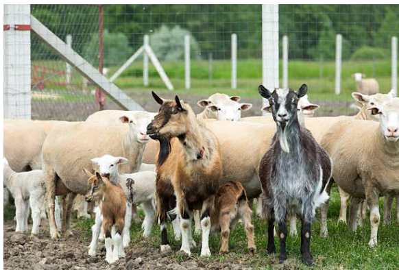
Imagen representativa de las especies involucradas.

El 7 de julio de 2026, el Ministerio de Agricultura, Silvicultura y Pesca de Croacia informó la confirmación de un nuevo brote de Peste de los Pequeños Rumiantes (PPR) en una explotación ovina ubicada en la localidad de Čeralije, municipio de Voćin, en el condado de Virovitica-Podravina, elevando a 11 el número total de brotes registrados en el país desde principios de junio.