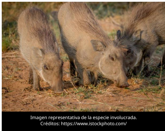
Imagen representativa de la especie involucrada.

El 1 de julio de 2026, el Servicio Veterinario y Alimentario (PVD) de Letonia exhortó a los porcicultores a fortalecer las medidas de bioseguridad en sus explotaciones, al iniciar el periodo de mayor riesgo para la propagación de la Peste Porcina Africana (PPA), durante el cual el virus presenta una mayor circulación en la fauna silvestre.