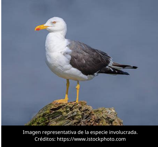
Imagen representativa de la especie involucrada.

El 1 de julio de 2026, la Dirección General de Alimentación y Veterinaria (DGAV) de Portugal, realizó una notificación inmediata ante la Organización Mundial de Sanidad Animal (OMSA) por el motivo de "Recurrencia de una enfermedad erradicada", tras la detección de nuevos casos de Influenza Aviar de Alta Patogenicidad (IAAP) en una gaviota sombría ( Larus fuscus ) y en una gaviota patiamarilla ( Larus michahellis ), ubicadas en las ciudades de Lisboa y Aveiro.