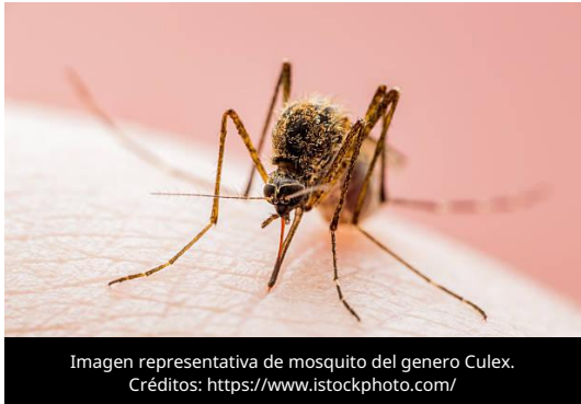
Imagen representativa de mosquito del genero Culex.

El 30 de junio de 2026, la Autoridad Europea de Seguridad Alimentaria (EFSA) en conjunto con el Centro Europeo para la Prevención y el Control de Enfermedades (ECDC) publicaron su informe mensual de vigilancia del Virus del Oeste del Nilo (VON), en el que informaron que, hasta el 24 de junio, se habían confirmado tres casos humanos autóctonos en Europa, dos en Italia y uno en Macedonia del Norte, sin defunciones asociadas. Asimismo, se notificaron cinco brotes en animales,