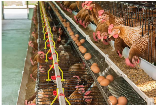
Imagen representativa de la especie involucrada.

El 30 de junio de 2026, el Ministerio de Agricultura, Pesca y Alimentación (MAPA) de España informó la confirmación de un nuevo foco de enfermedad de Newcastle en una granja de gallinas ponedoras ubicada en el municipio de Olmedo, provincia de Valladolid, elevando a seis el número total de focos registrados en la zona. La explotación afectada, con un censo aproximado de 301,191 aves, presentó una disminución en la producción de huevos y un ligero incremento en la mortalidad.