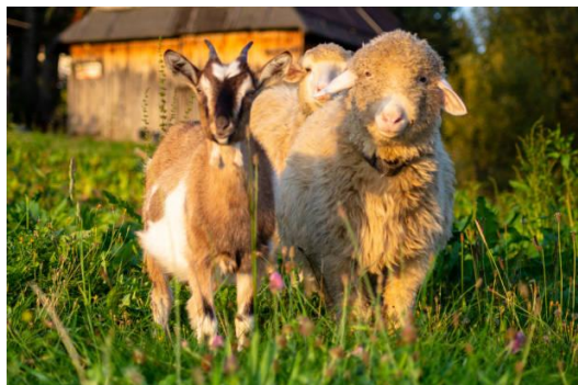
Imagen representativa de las especies involucradas.

El 1 de julio de 2026, la Oficina Nacional de Seguridad de la Cadena Alimentaria (Nébih) de Hungría exhortó a los productores a reforzar las medidas de prevención para evitar la introducción de la Peste de los Pequeños Rumiantes (PPR), tras la confirmación de nuevos casos en Croacia y Rumanía. Asimismo, recordó que permanece prohibida la importación de ovejas y cabras procedentes de zonas afectadas por la enfermedad.