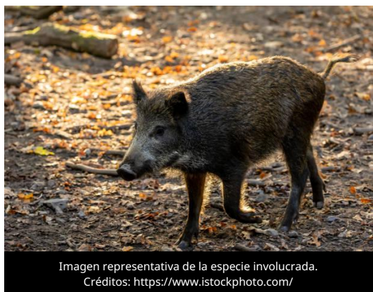
Imagen representativa de la especie involucrada.

El 1 de julio de 2026, el Instituto de Investigación y Tecnología Agroalimentarias (IRTA) informó que continúan las diligencias judiciales ordenadas por el Tribunal de Instancia de Cerdanyola del Vallès para esclarecer el origen del brote de Peste Porcina Africana (PPA) registrado en Cataluña. Asimismo, el organismo reiteró su disposición de colaborar plenamente con las autoridades durante el desarrollo de la investigación.