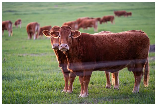
Imagen representativa de la especie involucrada.

El 30 de junio de 2026, el Delegado de Azerbaiyán ante la Organización Mundial de Sanidad Animal (OMSA) y Jefe de los Servicios Veterinarios informó la realización de un ejercicio de simulación el 1 de julio sobre Fiebre Aftosa (FA) en el distrito de Goygol, con el propósito de fortalecer la preparación nacional y regional frente a enfermedades animales transfronterizas y mejorar la capacidad de respuesta ante emergencias zoonositarias.