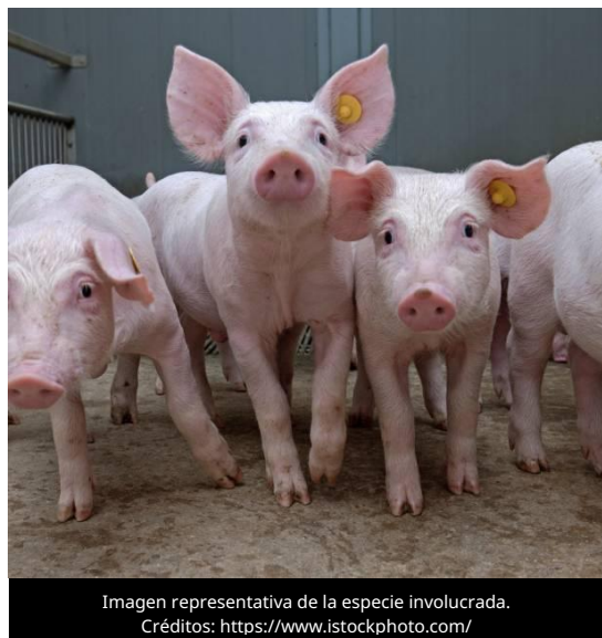
Imagen representativa de la especie involucrada.

El 1 de julio de 2026, la Agencia de Noticias de Filipinas (PNA) informó que el gobernador de la provincia de Negros Oriental confirmó la presencia de casos de Peste Porcina Africana (PPA) en el municipio de La Libertad, tras obtener resultados positivos en pruebas de laboratorio realizadas a muestras de sangre de cerdos.