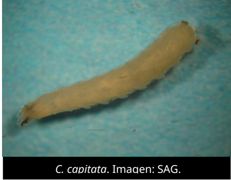
C. capitata .

El 7 de abril de 2026, el Servicio Agrícola y Ganadero de Chile (SAG) notificó una nueva cuarentena de la mosca del Mediterráneo ( Ceratitis capitata ) en la comuna de Camarones (provincia de Arica, región de Arica y Parinacota), tras la detección de un foco larvario.