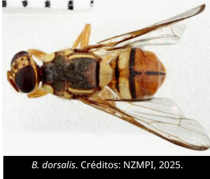
B. dorsalis .

A través del Servicio de Reportes (núm. de marzo de 2026) de la Organización Europea y Mediterránea para la Protección Fitosanitaria (EPPO), y con base en información de la Organización Nacional de Protección Fitosanitaria (ONPF) de España, se notificó el primer reporte de la mosca oriental de la fruta ( Bactrocera dorsalis ) en ese país.