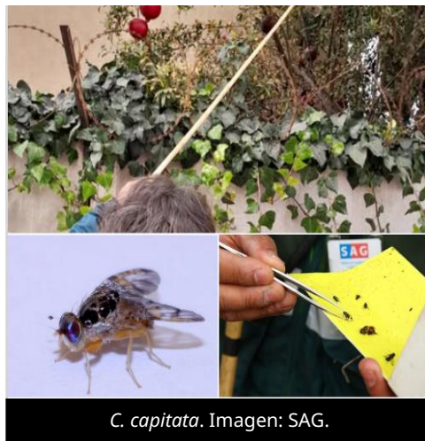
C. capitata .

El 6 de abril de 2026, el Servicio Agrícola y Ganadero de Chile (SAG) notificó la ampliación de la cuarentena de la mosca del Mediterráneo ( Ceratitis capitata ) en Huanta (comuna y provincia de Arica, región de Arica y Parinacota), tras la detección adicional de la plaga.