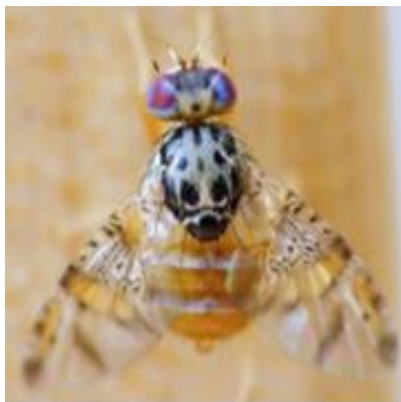
C. capitata .

El 6 de abril de 2026, el Servicio Agrícola y Ganadero de Chile (SAG) notificó la ampliación de la cuarentena de la mosca del Mediterráneo ( Ceratitis capitata ) en Chitita (comuna de Camarones, provincia de Arica, región de Arica y Parinacota), tras la detección adicional de la plaga.