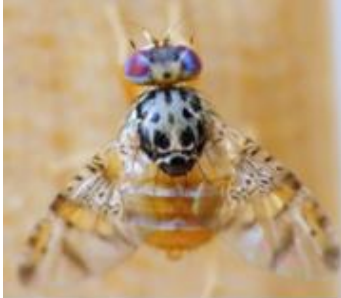
C. capitata .

El 6 de abril de 2026, el Servicio Agrícola y Ganadero de Chile (SAG) notificó una nueva cuarentena de la mosca del Mediterráneo ( Ceratitis capitata ) en la localidad del Valle de Azapa (comuna y provincia de Arica, región de Arica y Parinacota), tras la detección de un ejemplar de la plaga.