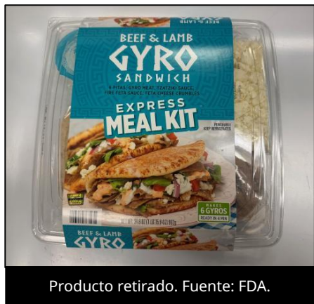
Producto retirado.

EUA: Fresh Creative Foods retira del mercado kits de comida por contener pepino potencialmente contaminado con Salmonella spp.