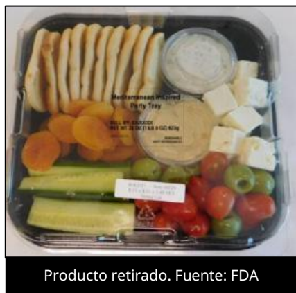
Producto retirado.

EUA: F&S Fresh Foods retira del mercado kits de comida por contener pepino potencialmente contaminado con Salmonella spp.