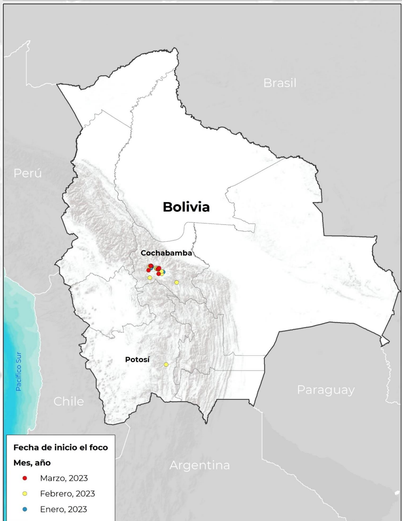
Porcentaje de focos por provincia