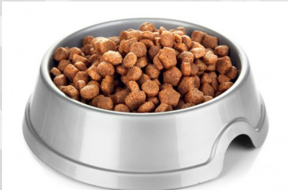
Imagen representativa del producto afectado.

Recientemente, a través del Sistema de Alerta Rápida para Alimentos y Piensos (RASFF, por sus siglas en inglés), se notificó que las autoridades de Países Bajos retiraron del alimento para mascotas debido a la detección de trazos de metal, además estos productos también fueron distribuidos en Alemania.