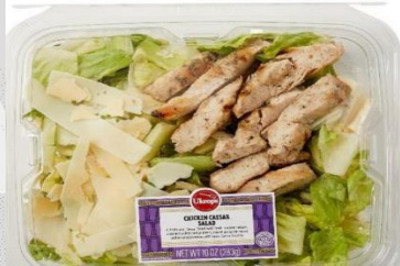
Imagen representativa del producto afectado.

Recientemente, la Agencia de Administración de Medicamentos y Alimentos (FDA, por sus siglas en inglés), informó que la empresa Ukrop's Homestyle Foods está retirando de manera voluntaria del mercado diversas ensaladas con carne de pollo y cerdo, debido a la presencia de piezas de plástico duro de color marrón, estos productos fueron distribuidos en los estados de Carolina del Norte, Virginia, West Virginia, Tennessee, Kentucky y Ohio.