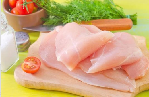
Imagen representativa del producto afectado.

Recientemente, a través del Sistema de Alerta Rápida para Alimentos y Piensos (RASFF, por sus siglas en inglés) se notificó que las autoridades de Polonia retiraron del mercado filetes de pollo para el consumo, debido a la detección de Salmonella Enteritidis. Este hecho ha sido calificado por el RASFF como grave.