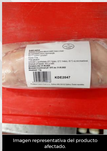
Imagen representativa del producto afectado.

Recientemente, la oficina de la Autoridad Checa de Inspección Agrícola y Alimentaria informó sobre la detección de Salmonella Entérica en suero de carne de muslos de conejo congelada, importada de China.