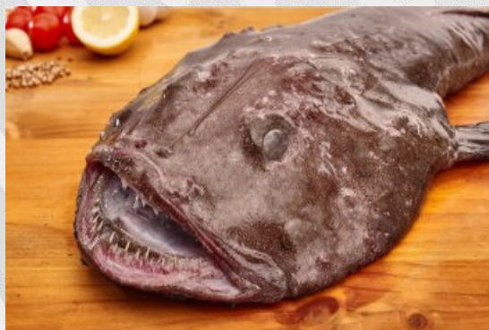
Imagen representativa del producto afectado.

Recientemente, a través del Sistema de Alerta Rápida para Alimentos y Piensos (RASFF, por sus siglas en inglés) se notificó que las autoridades de Alemania rechazaron envasados de Lophius para el consumo humano importados de Portugal debido a la detección de cuerpos extraños (trozos de papel aluminio).