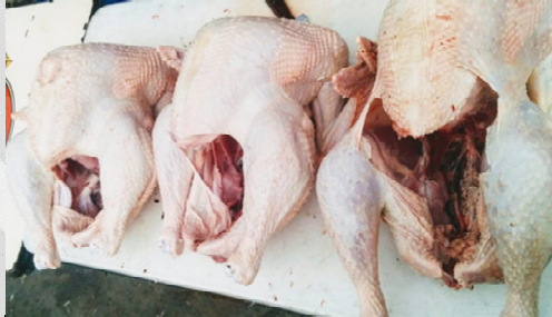
Imagen representativa del producto afectado.

Recientemente, a través del Sistema de Alerta Rápida para Alimentos y Piensos (RASFF, por sus siglas en inglés) se notificó que las autoridades de Chipre rechazaron canales de pavo para el consumo humano importados de Polonia debido a la detección de Salmonella spp.