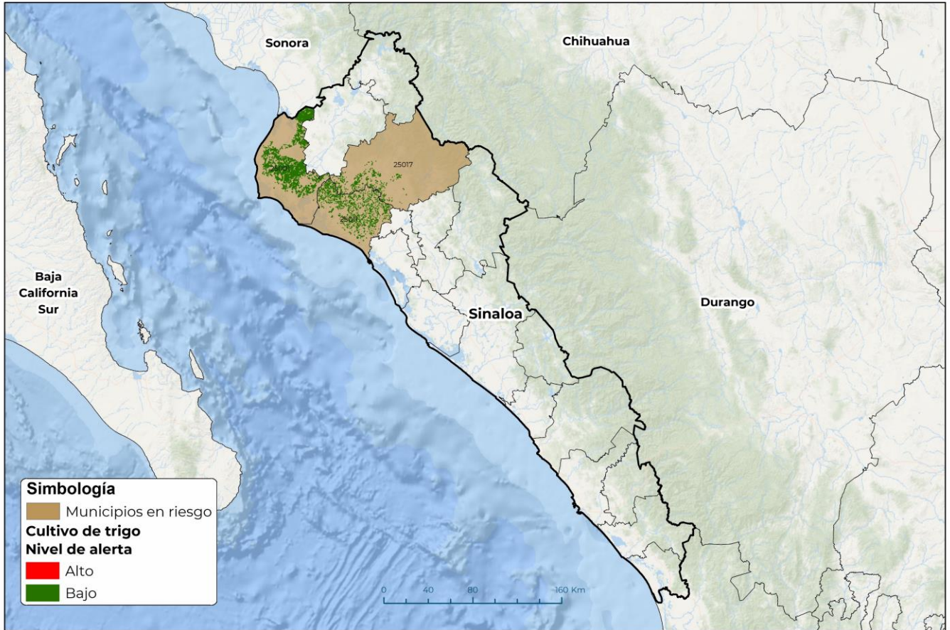
Municipios con cultivo y probable riesgo por Roya de la hoja del trigo en Sinaloa

GEOMATICA-D3-SENASICA © 2024 DAHF FECHA: 04-MARZO-2024