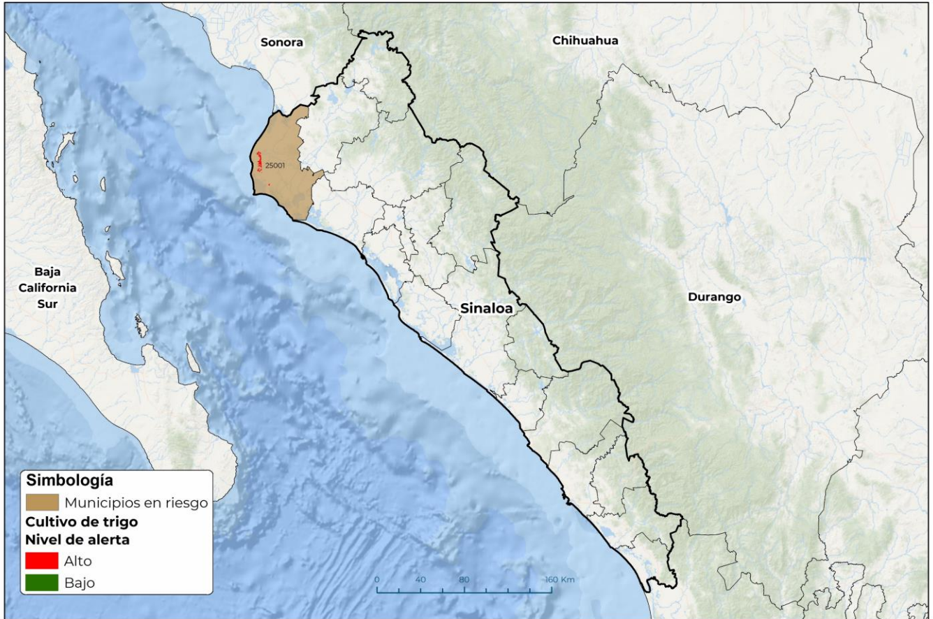
Municipios con cultivo y probable riesgo por Roya de la hoja del trigo en Sinaloa

GEOMATICA-D3-SENASICA © 2024 DAHF FECHA: 26-FEBRERO-2024