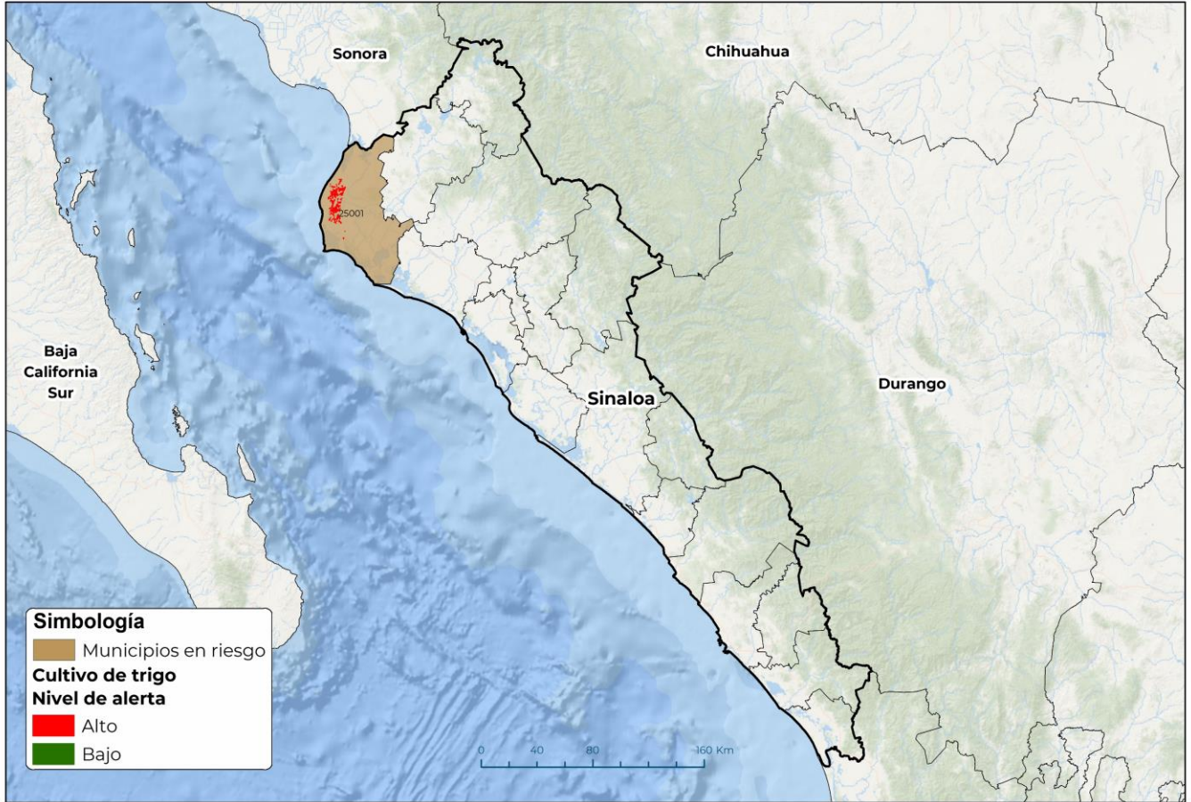
Municipios con cultivo y probable riesgo por Roya de la hoja del trigo en Sinaloa

GEOMÁTICA-D3-SENASICA © 2024 DAHF FECHA: 29-ENERO-2024