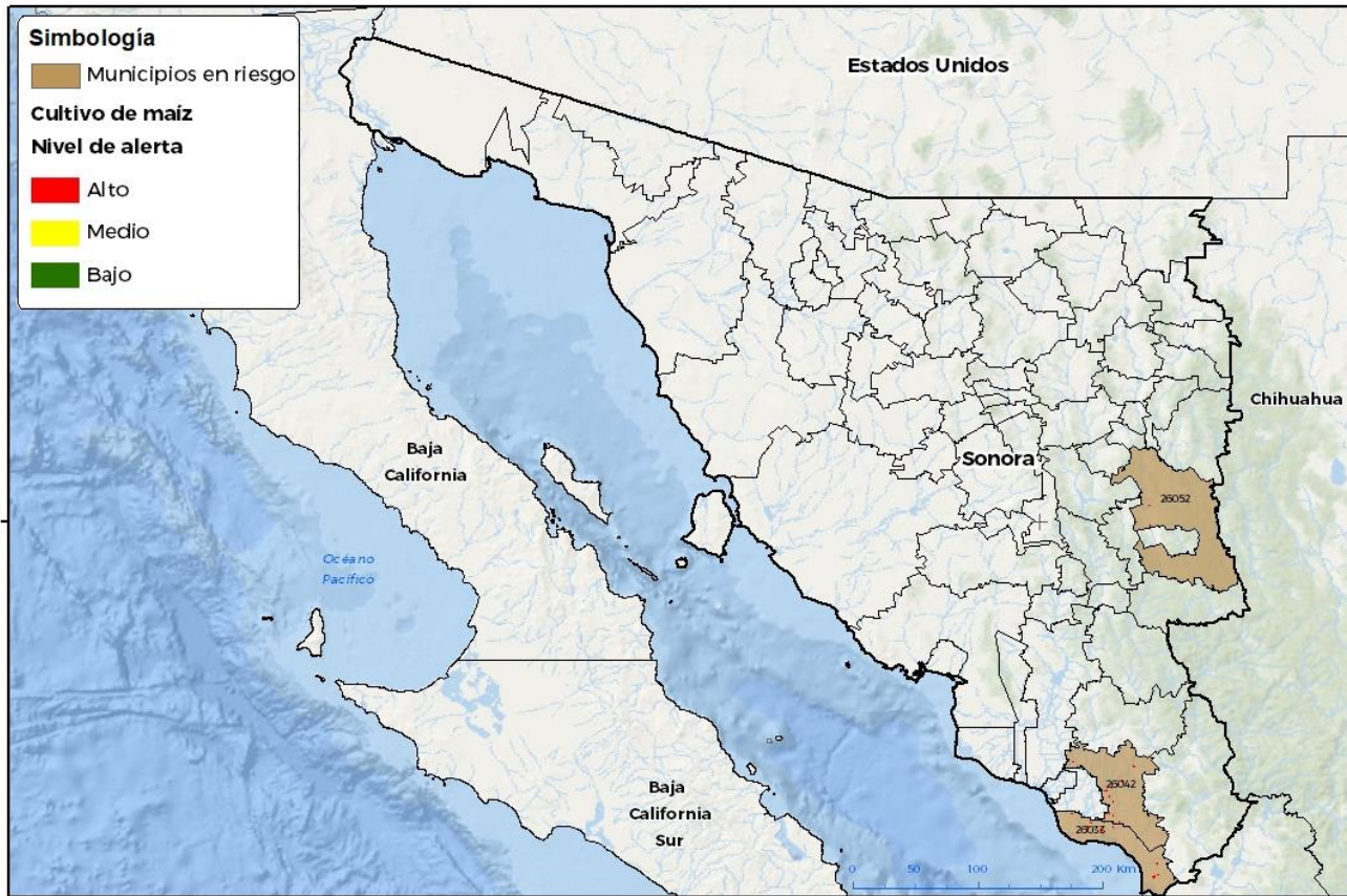
Municipios con cultivo y probable riesgo por Gusano elotero en Sonora

GEOMATICA-D3-SENASA-A-2024-RGR FECHA: 26 JUNIO 2024