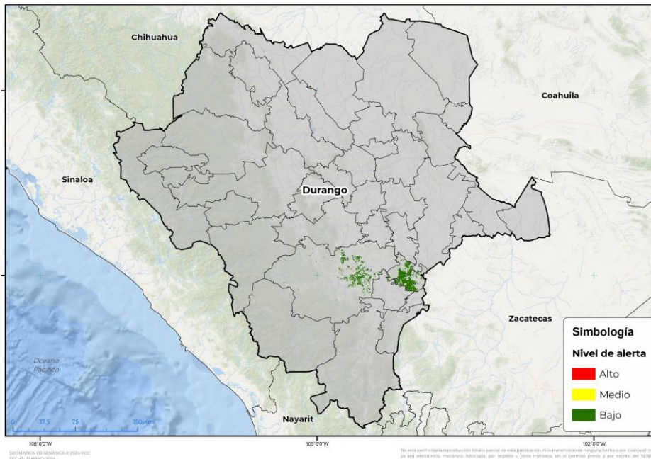
Nivel de alerta por Conchuela del frijol en Durango

Se determina que la plaga puede comenzar su desarrollo debido a que hay: • 2 municipios con nivel de alerta bajo (Anexo 1).