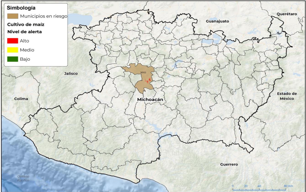
Municipios con cultivo y probable riesgo por Chapulín en Michoacán

GRMÁTICA (I) SENASICA © 2024 BCC FECHA: 29-ABRIL-2024