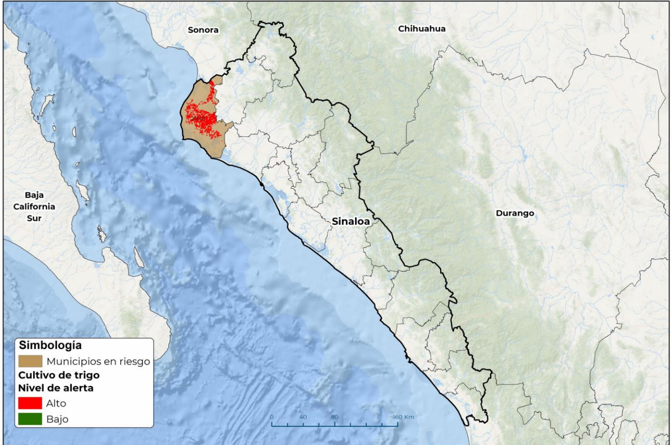
Municipios con cultivo y probable riesgo por Roya de la hoja del trigo en Sinaloa

GEOMÁTICA-D3-SENASICA © 2023 DAHF FECHA: 27-NOVIEMBRE-2023