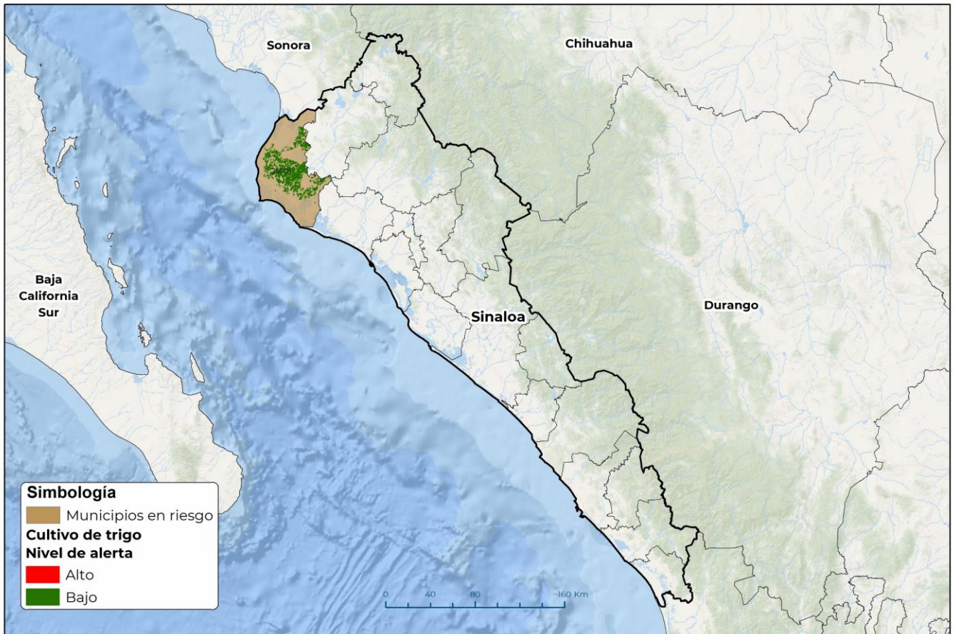
Municipios con cultivo y probable riesgo por Roya de la hoja del trigo en Sinaloa

GEOMÁTICA-D3-SENASICA © 2023 DAHF FECHA: 13-NOVIEMBRE-2023