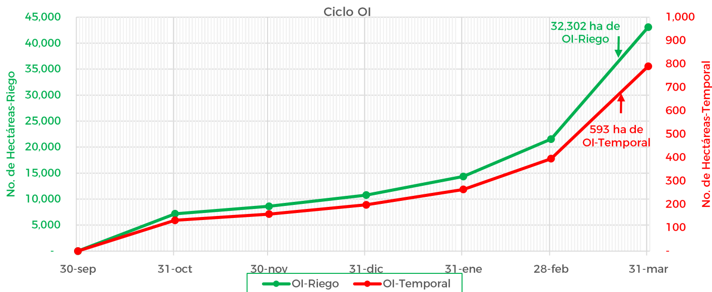
Avance de siembra de trigo en el estado de Michoacán al 20 de marzo del 2023

De acuerdo con los registros del SIAP, se estima un avance de siembra de la siguiente manera: