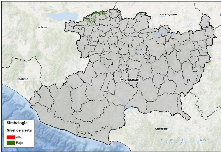
Nivel de alerta por Roya de la hoja del trigo en Michoacán

Se identifica que la roya de la hoja del trigo puede iniciar su proceso de infección debido a que hay: