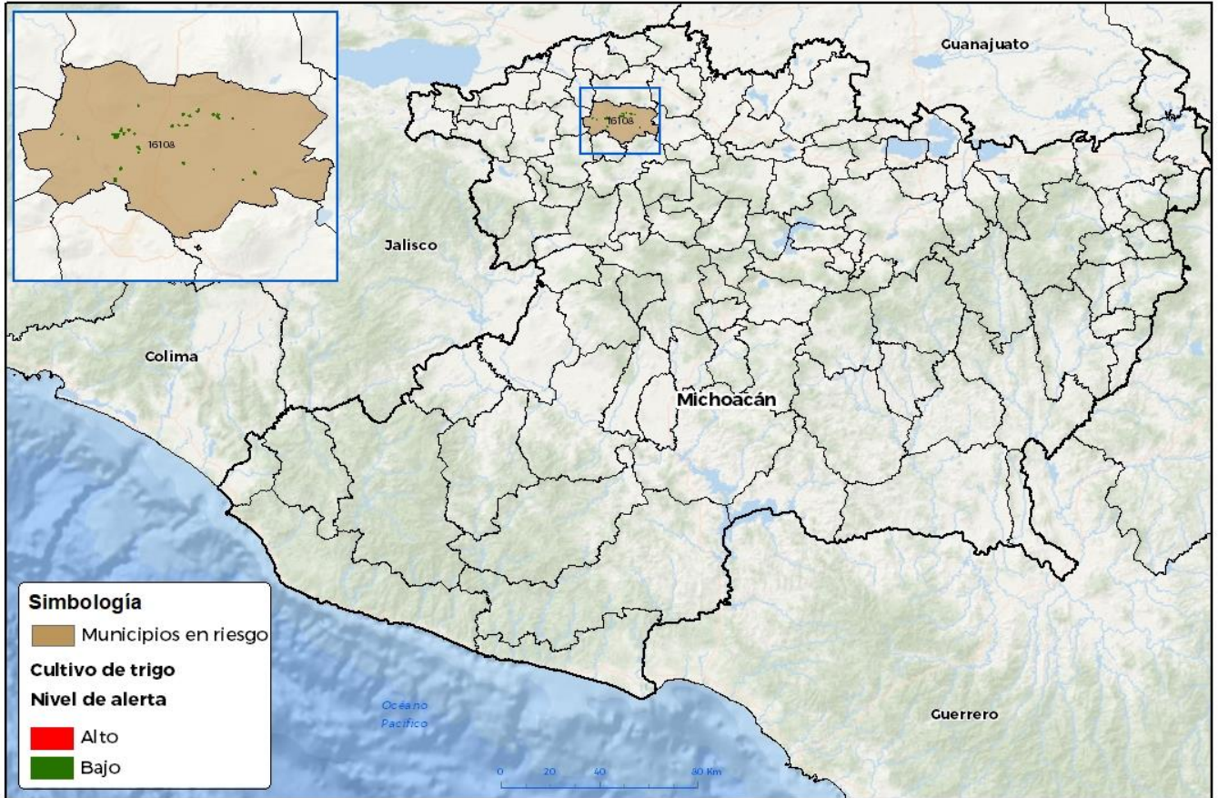
Municipios con cultivo y probable riesgo por Roya de la hoja del trigo en Michoacán

GEONATICA-DI-SENASICA © 2023 RGR FECHA: 04 DICIEMBRE 2023