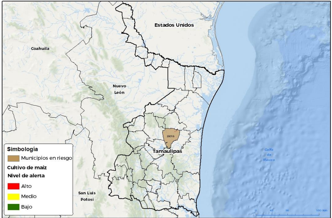
Municipios con cultivo y probable riesgo por Gusano cogollero en Tamaulipas

GEOMATICA D3.SENASICA - 2023 RGR FECHA: 30 MARZO 2023