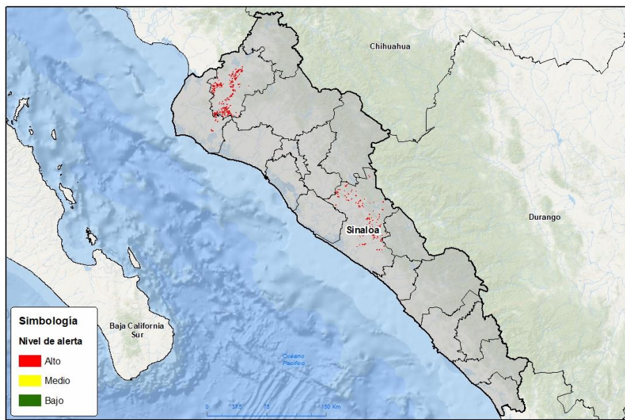
Nivel de alerta por Gusano cogollero en Sinaloa

Se determina que la plaga puede comenzar su desarrollo debido a que hay: