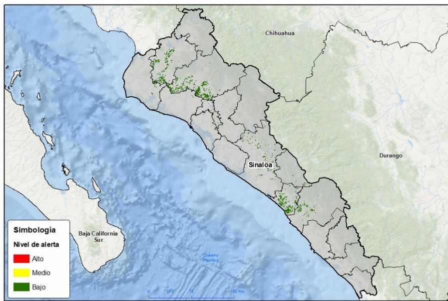
Nivel de alerta por Gusano cogollero en Sinaloa

Se determina que la plaga puede comenzar su desarrollo debido a que hay: