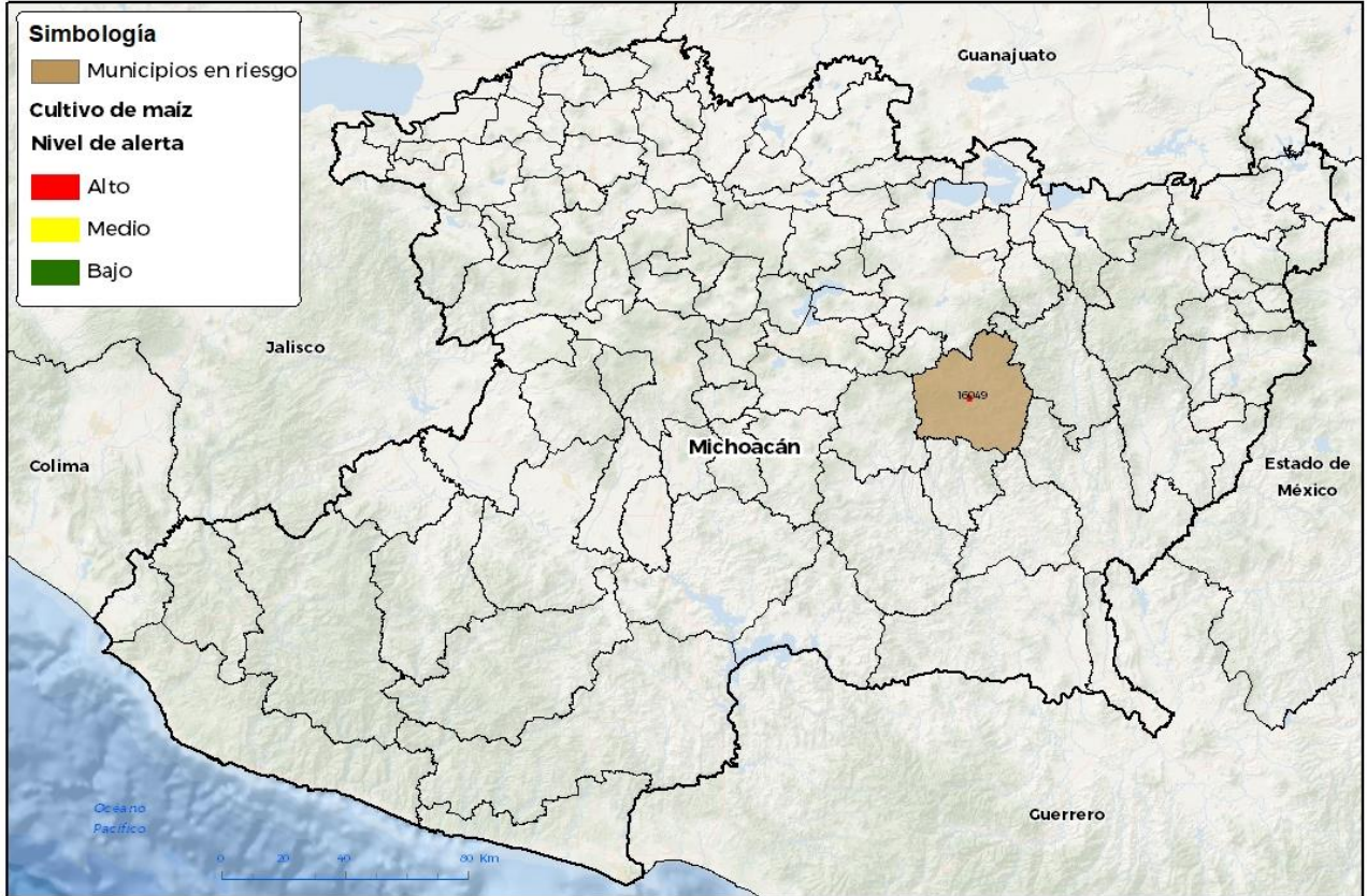
Municipios con cultivo y probable riesgo por Gusano cogollero en Michoacán

No está permitida la reproducción total o parcial de esta publicación, ni la transmisión de ninguna forma o por cualquier medio, ya sea electrónico, mecánico, fotocopia, por registro u otros métodos, sin el permiso previo y por escrito del SENASICA.