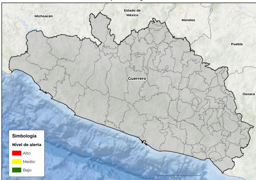
Nivel de alerta por Gusano cogollero en Guerrero

Se identifica que la plaga tiene bajas condiciones para comenzar su desarrollo debido a que se identificaron 9 municipios en riesgo fitosanitario bajo (Anexo1).