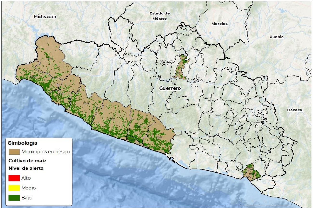
Municipios con cultivo y probable riesgo por Gusano cogollero en Guerrero

SEMAYTICA-02-SENASICA 8 2023 D.A.M.F. FECHA: 03-ABRIL-2023