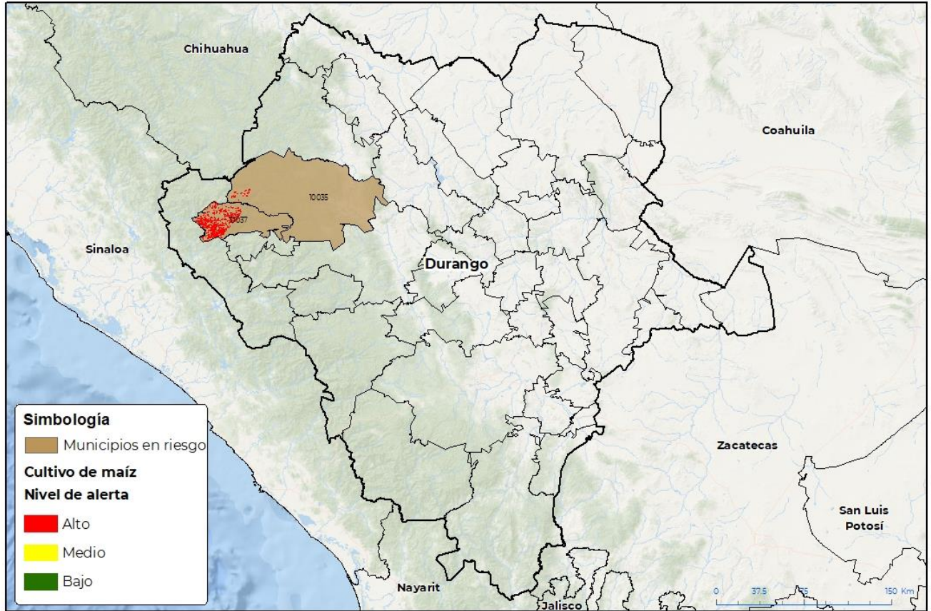
Municipios con cultivo y probable riesgo por Gusano cogollero en Durango

IGBOMATICA-DI-SENASICA © 2023 PCC FECHA: 10-MAYO-2023