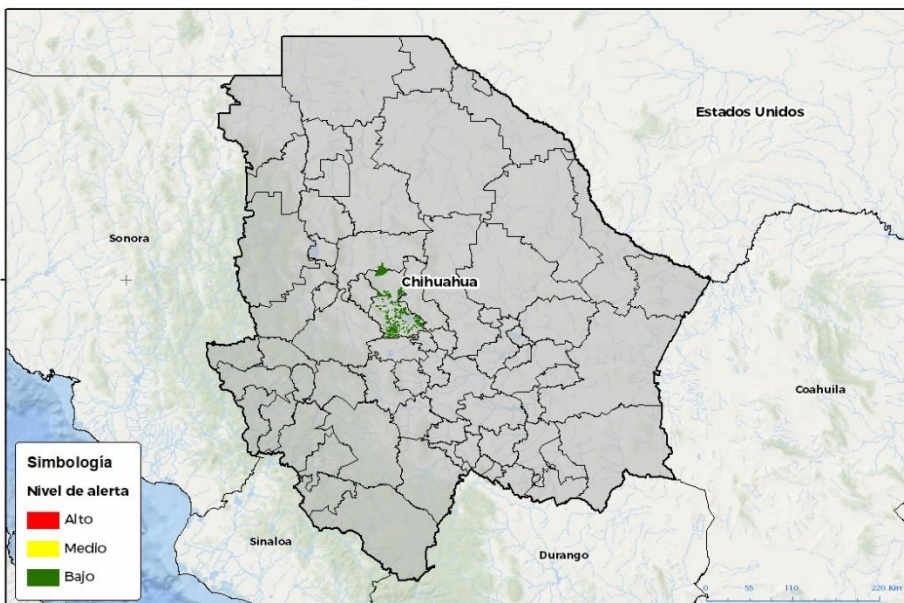
Nivel de alerta por Conchuela del frijol en Chihuahua

Se determina que la plaga puede comenzar su desarrollo debido a que hay: