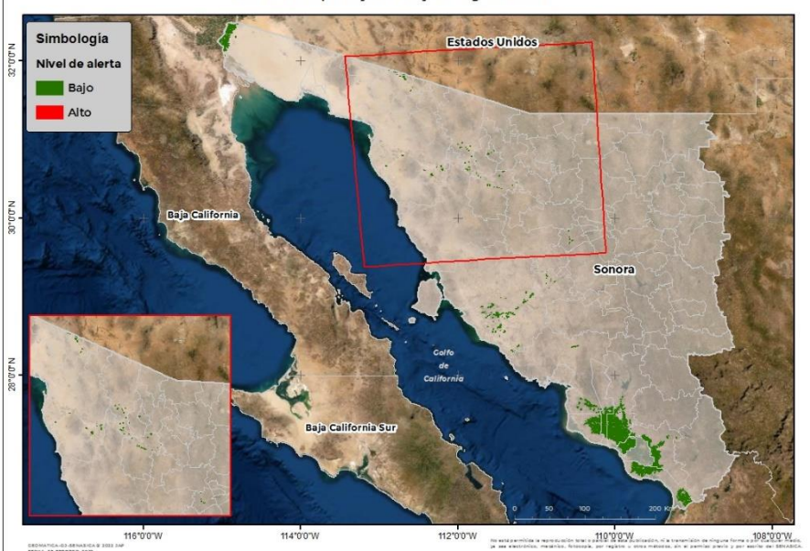
Nivel de alerta por Roya de la hoja del trigo en Sonora

Se identifica que la Roya de la hoja del trigo puede iniciar su proceso de infección debido a que existen condiciones favorables en 16 municipios en riesgo fitosanitario bajo (Anexo 1).