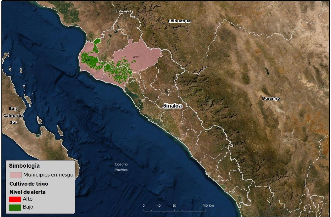
Municipios con cultivo y probable riesgo por Roya de la hoja del trigo en Sinaloa

CEM-ATICA-01-SENASICA © 2022 9CR FECHA: 28-FEBRERO-2022