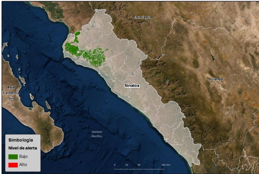
Nivel de alerta por Roya de la hoja del trigo en Sinaloa

Se identifica que la Roya de la hoja del trigo puede iniciar su proceso de infección debido a que se identificaron 3 municipios en riesgo fitosanitario bajo (Anexo 1).