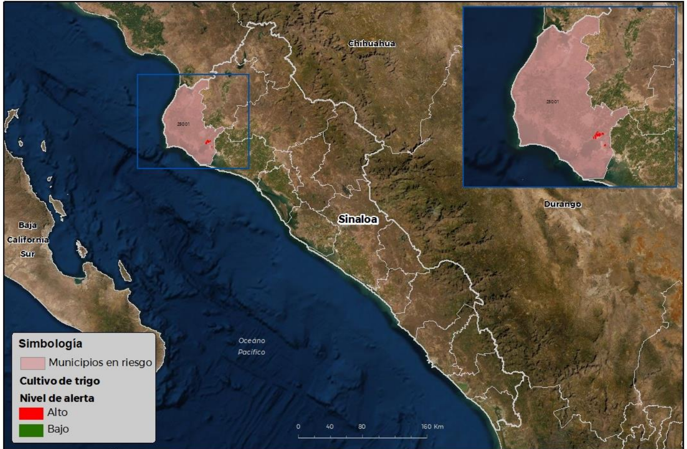
Municipios con cultivo y probable riesgo por Roya de la hoja del trigo en Sinaloa

COORDINADAS: SENASICA © 2022 9CR FECHA: 14-FEBRERO-2022