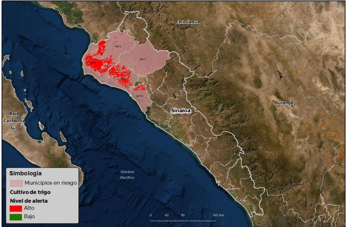
Municipios con cultivo y probable riesgo por Roya de la hoja del trigo en Sinaloa

Anexo 1.- Se han identificado 5 municipios con riesgo alto, y presencia del cultivo para el proceso de infección de Roya de la hoja del trigo, mismos que en caso de presentarse la plaga estarían en riesgo.