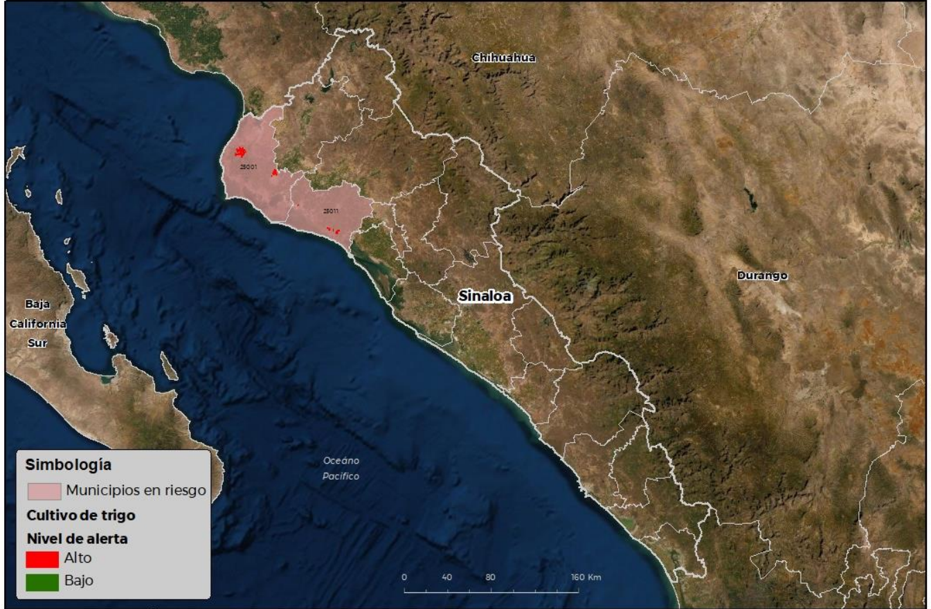
Municipios con cultivo y probable riesgo por Roya de la hoja del trigo en Sinaloa

CEM AF-SENASICA 8 2022 9CR FECHA: 03-ENE-2022