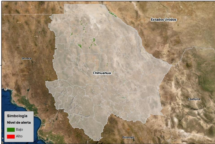
Nivel de alerta por Roya de la hoja del trigo en Chihuahua

Se identifica que la Roya de la hoja del trigo puede iniciar su proceso de infección debido a que se identificaron 6 municipios en riesgo fitosanitario bajo (Anexo 1).