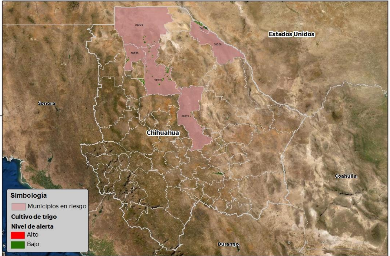
Municipios con cultivo y probable riesgo por Roya de la hoja del trigo en Chihuahua

110°00'W COORDINADAS: SENASICA © 2022 PDR FECHA: 07-MARZO-2022