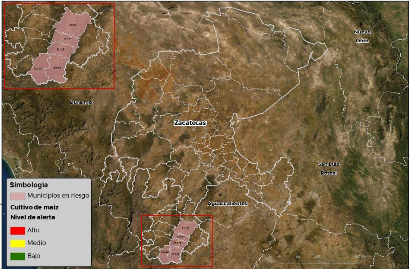
Municipios con cultivo y probable riesgo por Gusano cogollero en Zacatecas

CEOW ATICA-01-SENASICA 8 2022 P00 FECHA: 09-ENERO-2022