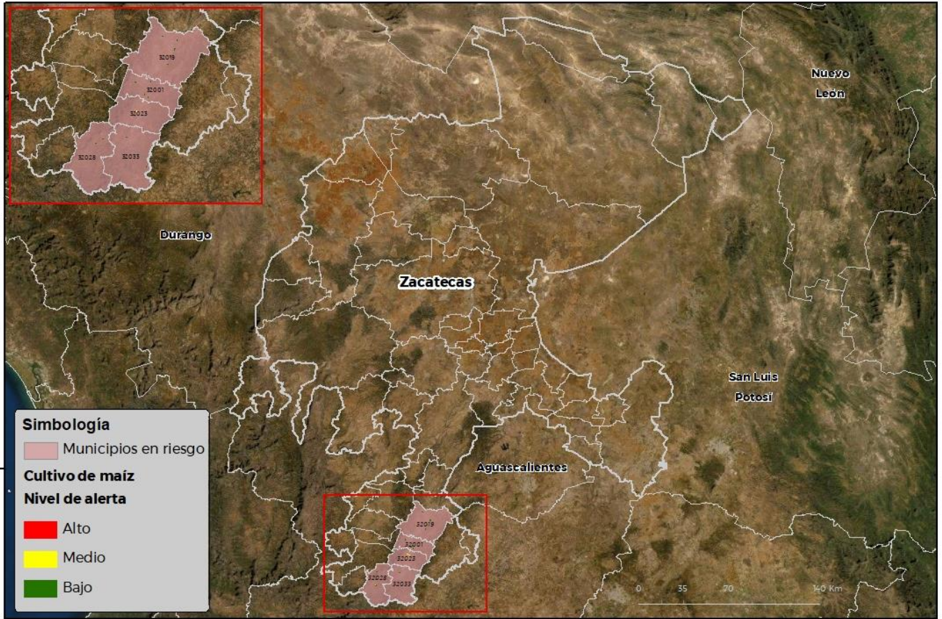
Municipios con cultivo y probable riesgo por Gusano cogollero en Zacatecas

CEOW ATICA-01-SENASICA 8 2021 P00 FECHA: 09-ENERO-2022