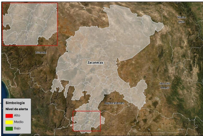
Nivel de alerta por Gusano cogollero en Zacatecas

Se identifica que la plaga tiene bajas condiciones para comenzar su desarrollo debido a que se identificaron 5 municipios en riesgo fitosanitario medio y bajo (Anexo 1).