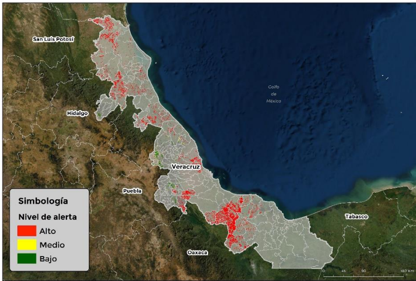
Nivel de alerta por Gusano cogollero en Veracruz

Se identifica que la plaga puede comenzar su desarrollo debido a que hay: