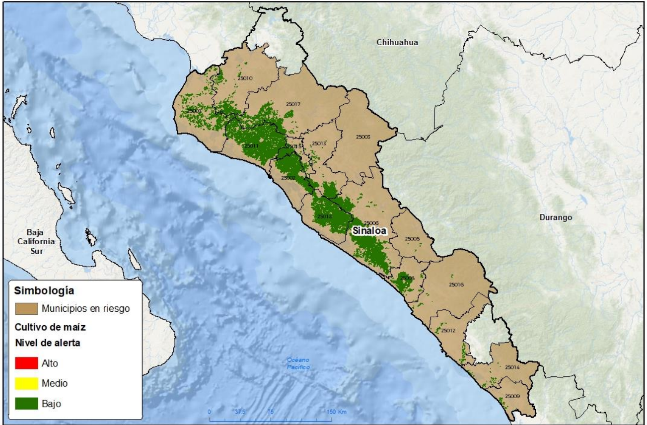
Municipios con cultivo y probable riesgo por Gusano cogollero en Sinaloa

GEOMÁTICA SINALOENSE © 2022 JAF FECHA: 03-NOV-2022 09:22