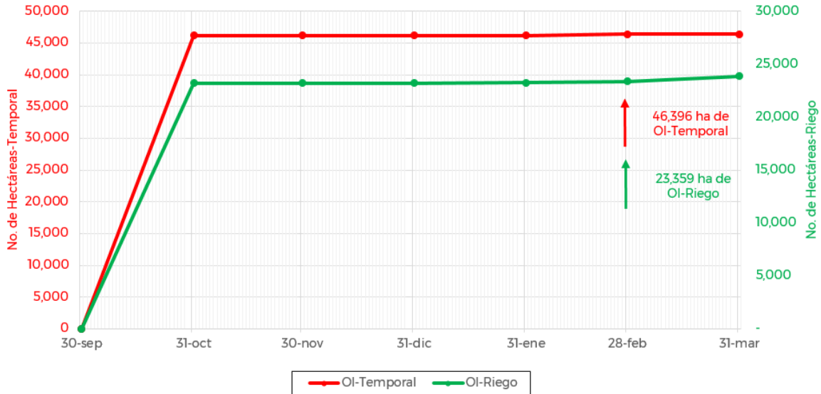
Avance de siembra de maíz en el estado de Oaxaca al 28 de Febrero de 2022 Ciclo OI

De acuerdo con los registros del SIAP, se estima un avance de siembra de la siguiente manera: