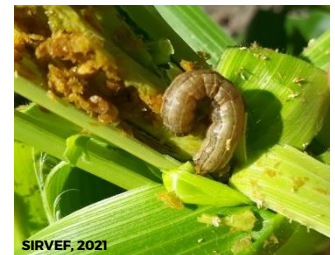
Nivel de alerta por Gusano cogollero en Michoacán