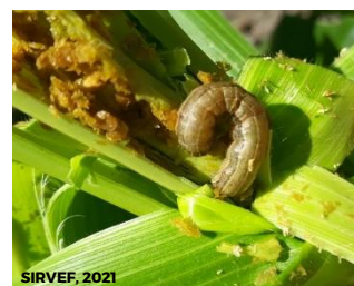
Nivel de alerta por Gusano cogollero en Michoacán