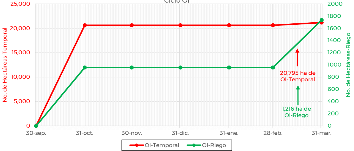
Avance de siembra de maíz en el estado de Hidalgo al 14 de Marzo de 2022 Ciclo OI

De acuerdo con los registros del SIAP, se estima un avance de siembra de la siguiente manera: