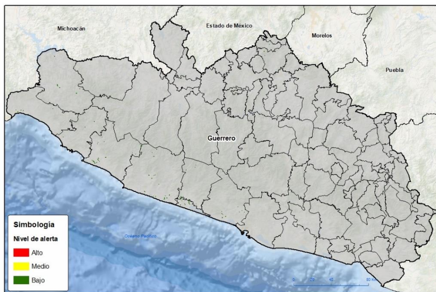
Nivel de alerta por Gusano cogollero en Guerrero

Se determina que la plaga puede comenzar su desarrollo debido a que hay: