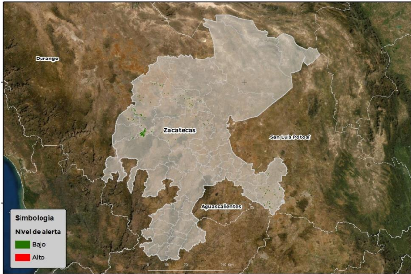
Nivel de alerta por Roya de la hoja del trigo en Zacatecas

Se identifica que la Roya de la hoja del trigo puede iniciar su proceso de infección debido a que existen condiciones favorables en 5 municipios en riesgo fitosanitario bajo (Anexo 1).